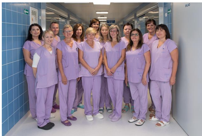
Obr. č. 7 Zdravotní sestry v barevném