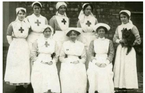
Obr. č. 4 Britské zdravotní sestry v úborech