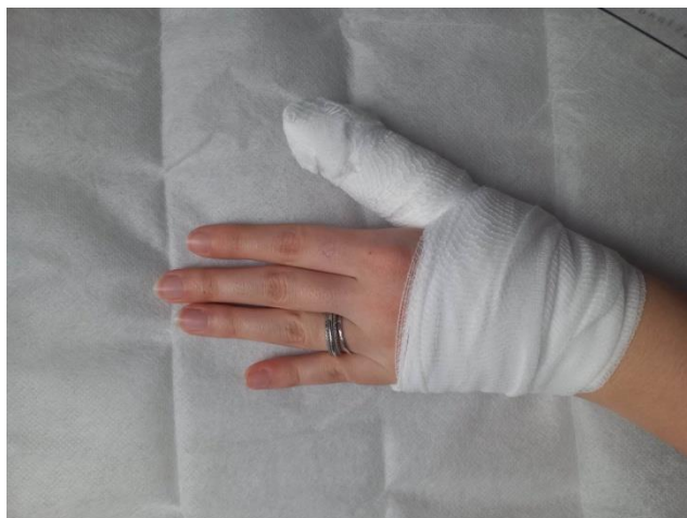
Obr. č. 10 Obvázaný palec

Zdravotnictví mě zajímá už od dětství. Jako malá jsem si často hrála na lékařku. Bavilo mě vždy někomu obvazovat rány obvazem nebo předepisovat recepty. Hodně se dívám na různé dokumenty z oblasti lékařství. A hlavně mě ve škole baví moc přírodopis konkrétně lidské tělo. Hlásím se na zdravotní školy do Kolína a Nymburka na obor praktická sestra. Přála bych si po střední škole udělat nástavbu a být dětská zdravotní sestra.