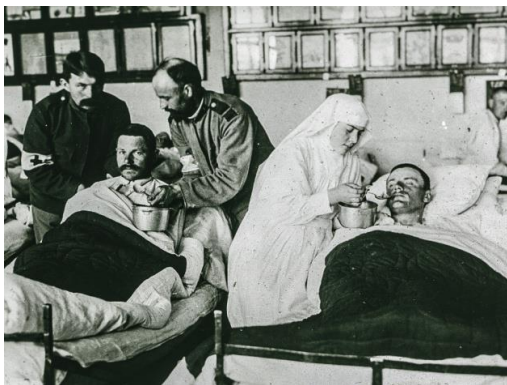
Obr. č. 3 Ošetrovna zraněných vojáků

Za první světové války byl nedostatek zdravotních sester, takže každá žena, která chtěla pomáhat, si udělala „kurz“, který měl trvat po zkrácení 2 roky. Ale z nedostatku času, každá zdravotní sestra vysvětlila dané ženě, co musí udělat, aby zachránila život vojáka. V polovině války kurz nebyl ani potřeba. Válka byla krutá a prostý lid nečekal, co se bude dít. Mnoho sester zemřelo nečekaně na otravu plynem či útokem neznámými zbraněmi. Jako pomoc zdravotníkům přispěla svými radiologickými prostředky polská vědkyně Marie Curie Skłodowska. Díky nimž mohli zdravotníci zjišťovat například zlomeninu nebo volnou tekutinu v těle. Po celém světě se začala rozvíjet organizace červeného kříže na pomoc vojákům a zraněným osobám. Ke konci války přišla další nečekaná rána. První vlna španělské chřipky. Nikdo netušil, o jak nebezpečnou chorobu se jedná. Zdravotnice nebyly vybaveny dostatečně materiály a léky. Proto umírali desítky milionů lidí a byl nedostatek lékařské služby. Po konci pandemie opět vzrostl počet zdravotníků.