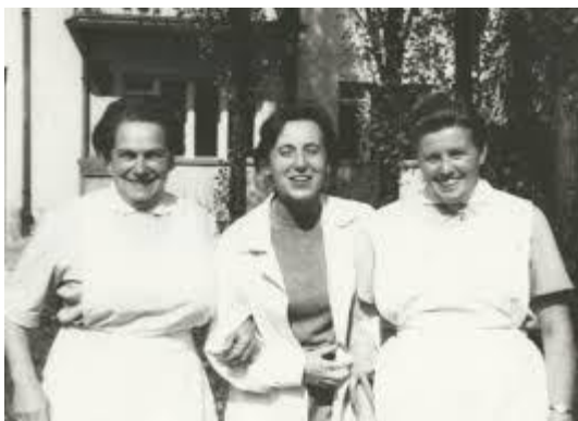
Obr. č. 5 Zdravotní sestry