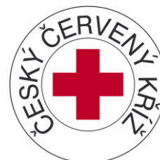
Obr. 9 Logo červeného kříže

Červený kříž založen roku 1863 v Evropě má českou odnož. Český červený kříž vznikl v roce 1993. Sestry pracující pro červený kříž mají širokou škálu pracovních povinností. Pomáhají při živelných katastrofách, v oblasti dárcovství, pomoc hendikepovaným i běžné první pomoci. Jezdí a poskytují kurzy první pomoci pro běžné občany.