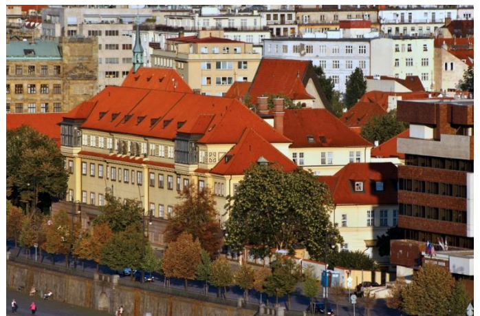
Obr. č. 2 Špitál na Františku