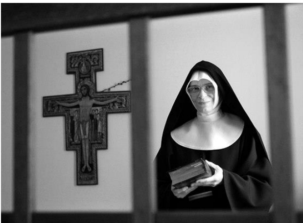
Obr. č. 1 Jeptiška

Ve středověku většinou léčily „Babky kořenářky“ svými bylinkami, z nichž vyráběly různé masti, čaje nebo oleje. Naši předci věřili, že nemoc je trest něčeho špatného, co vykonali ve svém životě, nebo také žili v přesvědčení, že za jejich nemoc či utrpení mohou nadpřirozené síly. A když si očistí duši, tak se uzdraví. Za nemocné se rodina modlila. Také se věřilo v sílu amuletů vyrobených z minerálů, směsí bylin nebo kůží. Nově se v blízkosti kostelů zřizovaly špitály, které byly často součástí klášterů. Pracovali tam především mniši a řeholnice. A právě z řeholnice je současná zdravotní sestra. Jedna z nejznámějších řeholnic byla sv. Anežka Česká. Řeholnice se většinou staraly o raněné vojáky, chudé nemocné rolníky či také o umírající staré lidi. Tyto ženy byly velice věřící v boha. Řeholnictví existuje dodnes, jen známe tyto sestry pod názvem jeptiška. První známý špitál je – Špitál na Františku, založený v roce 1232, fungující dodnes.