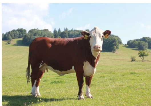
Obr. č. 4 Skot

Přes velmi silné industriální vlivy stále hraje důležitou roli primární sektor (zemědělství, lesnictví a rybářství). Jihočeský kraj má po kraji Vysočina druhý nejvyšší podíl zaměstnanosti v zemědělství (8,9%). Zemědělství Jihočeského kraje se v rostlinné výrobě orientuje na pěstování obilovin, olejnin (řepka olejka), brambor a ovoce (třešně, jablka, rybíz, švestky). V živočišné výrobě je významný chov skotu, drůbeže a prasat. Dlouholetou tradici má v Jihočeském kraji rybníkářství. Chov ryb v 25 000 ha vodních ploch představuje polovinu produkce v rámci celého Česka. Významná je produkce dřeva, zejména smrkového, ale i borového (Třeboňsko)