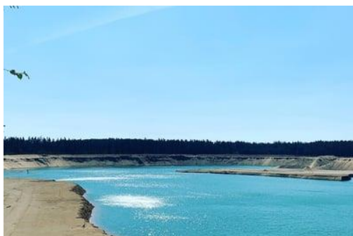
Obr.č. 10 Pískovna Halámky

navštívili Třeboňský zámek a velmi rozsáhlý park. Třeboňský zámek patří k největším zámeckým komplexům v České republice. O jeho rozsahu svědčí více než 100 obytných místností. Budovy Třeboňského zámku tvoří západní čelo Masarykova náměstí, na které zámecký areál plynule navazuje. Po prohlídce Třeboňského zámku jsme se vydali na Masarykovo náměstí, které mě uchvátilo svou velikostí a krásou. Další den jsme se jeli podívat na největší rybník na světě. Tento rybník se jmenuje Rožmberk, někdy je nazýván jihočeským mořem. Rybník byl navržen rožmberským regentem Jakubem Krčínem z Jelčan a Sedlčan a postaven v letech 1584 až 1590. Stavbu provádělo 800 lidí, kteří přemístili 750 000 m 3 zeminy. Den poté jsme se jeli podívat na pískovnu Halámky. Když jsem ji poprvé viděl, tak jsem si myslel, že je to moře, ale nakonec se ukázalo, že jde o pískovnu. Od kempu je vzdálená přibližně 40 kilometrů a je velmi navštěvovaná. Myslím si, že to je kvůli krásně modré vodě a tím, že tam je všude písek. A právě pro tyto památky a zajímavá místa bych vám chtěl jižní Čechy doporučit na výlet.