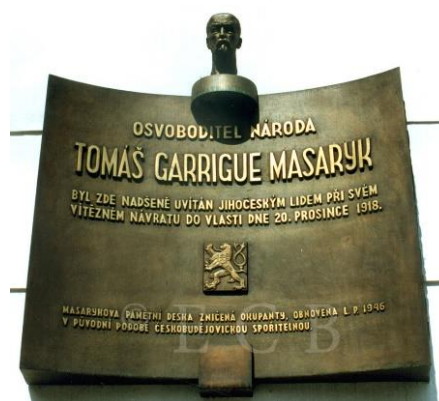
Obr.č.8 Památní deska