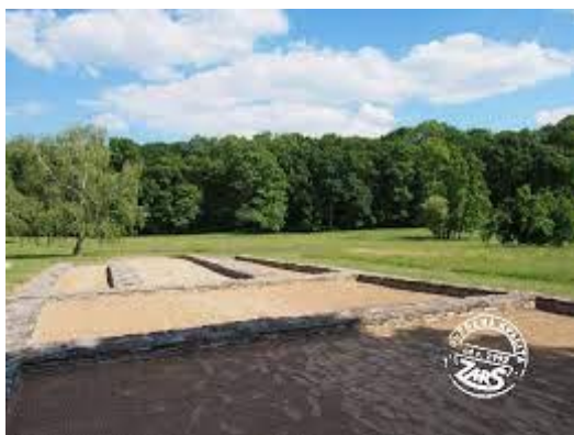
Obr. č. 1 Slovanské hradiště

Jižní Čechy jsou také spojeny s jedním z nejvýznamnějších českých šlechtických rodů středověku, Rožmberky, kteří ovládali jihočeská panství od 12. do 17. století. Tento rod vtiskl charakteristickou architektonickou podobu mnoha jihočeským městům. Oblast jižních Čech, která se do značné míry shoduje s územím dnešního Jihočeského kraje, se od pravěku až do dob raného středověku vyvíjela díky přírodním podmínkám poměrně nezávisle a svébytně a kultura i život obyvatel se odlišoval od okolního světa. Jedním z typických znaků bylo mohylové pohřbívání, které přetrvávalo i se střídajícími se kulturami. Od 6. až 7. století začali na území dnešního Jihočeského kraje pronikat Slované. Osídlení vznikalo postupně tak, jak pronikání Slovanů na území dnešního Jihočeského kraje umožňovala neúrodná zalesněná krajina. Od 2. poloviny 8. století budovali Slované opevněná hradiště, z nichž řada byla postavena na místech bývalých keltských hradišť.