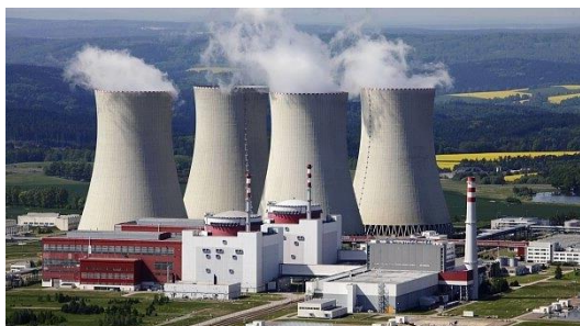
Obr. č. 2 Temelín

Po roce 1948 se v Jihočeském kraji začalo s budováním podniků, zaměřených především na strojírenský průmysl. Budování průmyslu navazovalo i na místní tradice, a to především v rozvoji dřevozpracujícího a potravinářského průmyslu (Jihočeské mlékárny). Rozložení průmyslových a obchodních ploch v Jihočeském kraji je v současnosti ovlivněno tradicí průmyslové výroby v městských centrech. V posledním období hraje roli i geografické umístění v blízkosti ekonomicky rozvinutých států – Rakouska a Německa. Průmyslová výroba je koncentrována především v českobudějovické aglomeraci a v okresech Tábor a Strakonice. Převažuje zpracovatelský průmysl (výroba dopravních prostředků, strojů, zařízení a elektrotechniky, výroba potravin a nápojů, textilní a oděvní). Novým energetickým centrem je jaderná elektrárna Temelín.