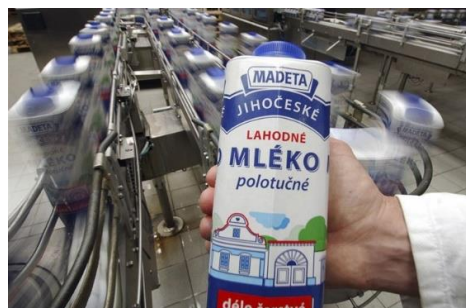
Obr. č. 3 Jihočeské mlékárny