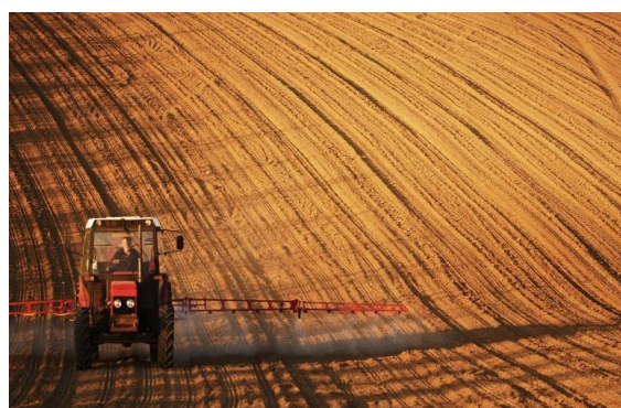
Obr. č. 5 Zemědělství