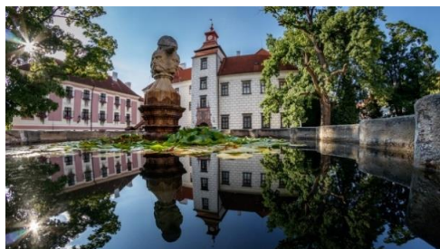
Obr.č.12 Třeboňský zámek