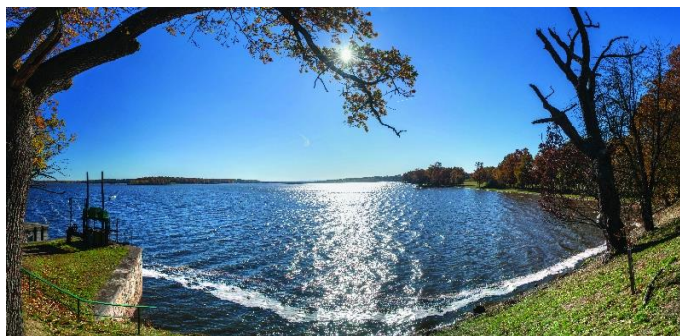
Obr.č.11 Rybník Rožmberk