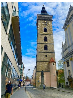
Obr.č.7 Černá věž