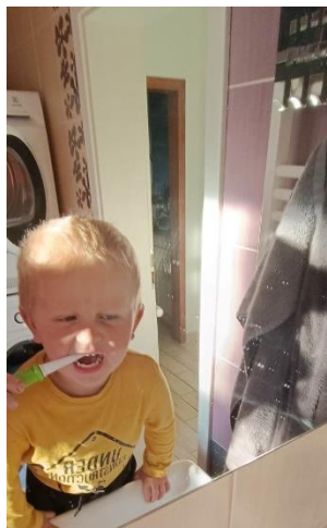
Obr. č. 2 čištění zubů

Jonášek si vzal s sebou svoje oblíbené auto na dálkové ovládání.