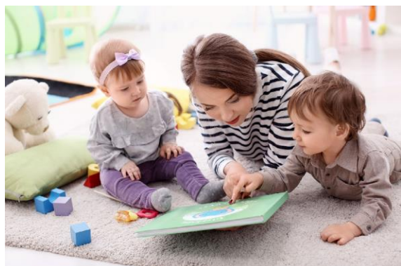
Obr. č. 1 hraní si s dětmi

Au pair nebo také babysitting je termín, který označuje hlídání cizích dětí. Osoba, která se stará o kojence a malé děti, se nazývá chůva nebo au pair. Většinou se jedná o dívky nebo mladé ženy. Mohou se ale i vyskytnout případy, kdy se o děti starají i muži.