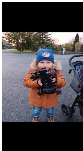
Obr. č.3 Jonášek s autem

Když jsme přišli z procházky domů, uvařili jsme si společně gulášovou polévku.