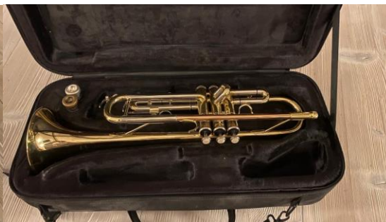
(obr. č. 18 – moje druhá trumpeta)