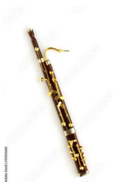
(obr. č. 13 – fagot)