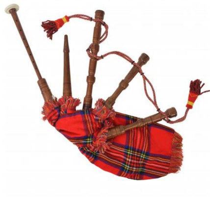
(obr. č. 6 – dudy)