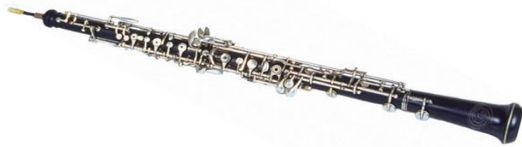
(obr. č. 10 – hoboj)