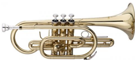
(obr. č. 8 – kornet)