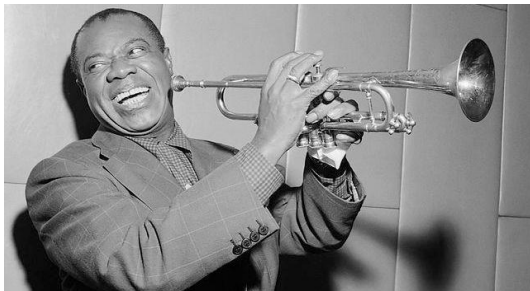
(obr. č. 16 – Louis Armstrong)

Narodil se 19. srpna 1901 v New Orleans a umřel 6. července 1971. Byl celosvětově známým americkým jazzovým trumpetistou a zpěvákem. Jsem si téměř jistý, že ho všichni minimálně jednou slyšeli. Ať už v rádiu nebo reklamě na Coca-Colu. Louis měl velice těžké dětství. Jeho otec se od rodiny odstěhoval a matka se o něj nestarala. Musel už od svých 10 let pracovat všemi možnými způsoby, aby měl na jídlo a léky pro svojí těžce nemocnou sestru. Ve 12 letech se dostal do polepšovny, kvůli střelbě do vzduchu na Silvestra. Právě tehdy začal hrát na dechový nástroj jménem kornet. K trumpetě se dostal až ve svých 18 letech, díky které si vybudoval celoživotní kariéru. Ta začala v kapele Tuxedo Brass Band. Poté vystřídal několik dalších kapel, ale na vrchol slávy se dostal, až když si založil vlastní kapelu nesoucí název Hot Five, kterou následně přejmenoval na Hot Seven. Když nabral slávy tak objížděl svět a hrál v různých filmech a muzikálech. V březnu roku 1965 dokonce přijel na 10 dní i do Československa, kde vystupoval v pražské Lucerně a byla to významná společenská událost. Na Hollywoodském chodníku slávy má hvězdu a jeho nejznámější skladba Melancholy Blues byla vyslána do vesmíru jako vzorek pozemské hudby.