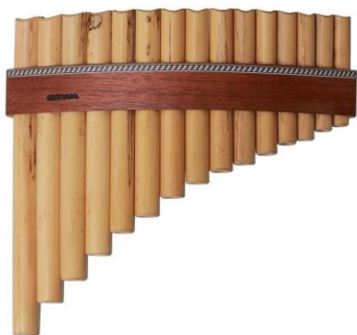
(obr. č. 3 – Panova píšťala)

Jedná se o 1. – 13. století. V důsledku preference vokální hudby (pouze zpěv) a zákazu hudby nástrojové ze strany křesťanství ustrnul v období středověku přirozený vývoj hudebních nástrojů. Některé nástroje, např. nátrubkové, degenerovaly na úroveň nástrojů signalizačních (varování formou zvuku). Zato varhany (obr. č. 2) byly pokládány za přepychový nástroj. V praxi se ale používalo mnohem více nástrojů, např. trouby z volských rohů, válečné rohy nebo třeba Panova píšťala (obr. č. 3).