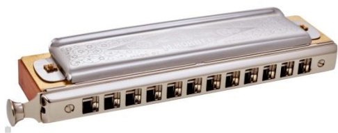
(obr. č. 14 – foukací harmonika)

Poslední skupinou dechových nástrojů jsou vícehlasé dechové nástroje, které se dělí na nástroje bez klaviatury a s klaviaturou nebo měchem. Příkladem nástroje bez klaviatury je foukací harmonika (obr. č. 14) a příkladem nástroje s klaviaturou nebo měchem jsou varhany (obr. č. 15).