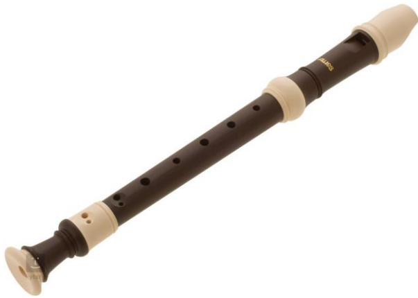
(obr. č. 4 – zobcová flétna)