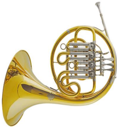
(obr. č. 9 – lesní roh)