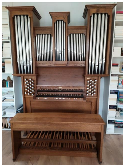
(obr. č. 15 – varhany)