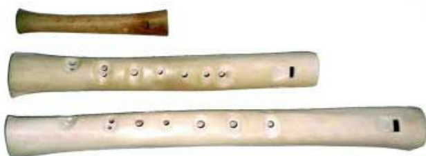
(obr. č. 1 - píšťaly z kostí)

V první fázi se jednalo o nástroje jednotónové a vyřezáváním otvorů do píšťal vznikaly později nástroje vícetónové. Dále se z pozdějšího pravěku dochovaly i první nátrubkové nástroje.