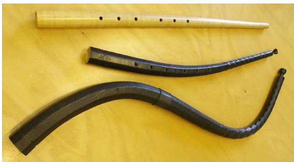
(obr. č. 5 – cink)