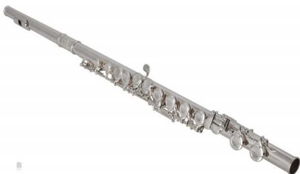
(obr. č. 7 – příčná flétna)

Jedná se o 17. – 18. století. V této době se vyžadoval větší tónový rozsah nástrojů. Díky tomu se příčná flétna (obr. č. 7) stala nejpopulárnějším sólovým nástrojem a vytlačila tak flétnu zobcovou. Trubka zde fungovala stále jako signalizační nástroj, ale začala se už používat i běžně. Dále se začal používat kornet (obr. č. 8), který je velice podobný trubce, ale má výrazně měkčí tón. Objevil se i lesní roh (obr. č. 9). Hrál se na něj ale převážně v církevní hudbě. Velice důležitým nástrojem byl hoboj (obr. č. 10), který se používal výhradně v sólových pasážích. V kostelech se začal objevovat regál (obr. č. 11). Regál je označení pro hudební nástroj, který byl velmi podobný varhanám, ale jeho zvuk byl znatelně silnější.