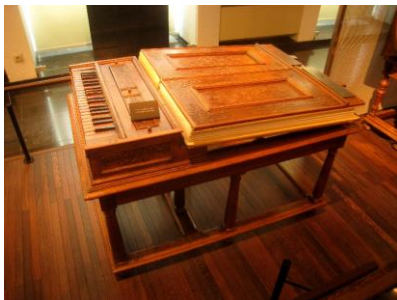
(obr. č. 11 – regál)