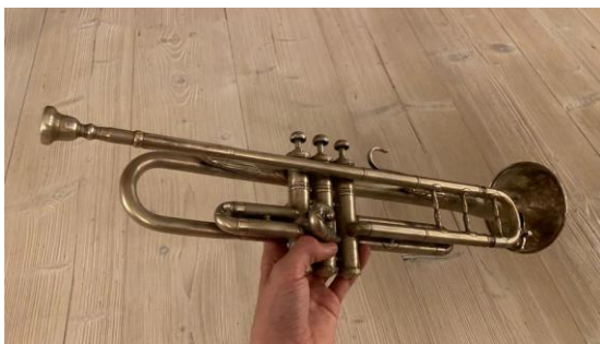
(obr. č. 17 – moje první trumpeta)

Vlastnil jsem a stále vlastním dvě trumpety. Jedna z nich je moje úplně první, kterou jsem s tátou koupil na tržišti v Praze (obr. č. 15). Druhá je moje současná, kterou jsem před několika lety dostal k narozeninám a má znatelně výraznější zvuk (obr. č. 16)