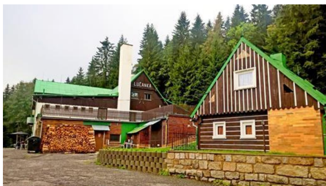
Obr. 2 Horská chata Lučanka

Na našem PTT (první týdenní tábor) se výchovní pracovníci skládají ze čtyř vedoucích, jednoho nebo dvou praktikantů a hlavní vedoucí. V tábořišti, kterým je horská chata Lučanka, která se nachází v Lučanech nad Nisou, jsou ještě další pracovníci, kteří ale nejsou výchovní. Tím je pan správce, který dohlíží na chod chaty a aby vše fungovalo tak, jak má, a jeho žena, která pro děti připravuje jídlo, dále paní uklízečka, která před příjezdem dětí připravuje chatu a po odjezdu uklízí.